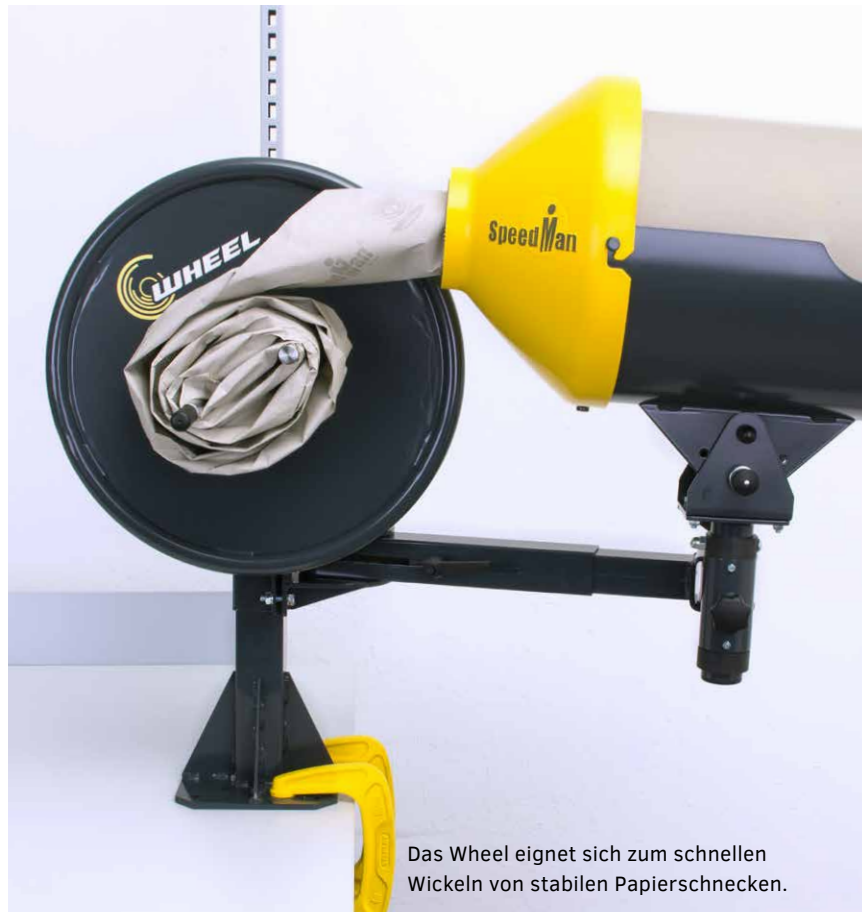
Das Wheel eignet sich zum schnellen Wickeln von stabilen Papierschnellen.