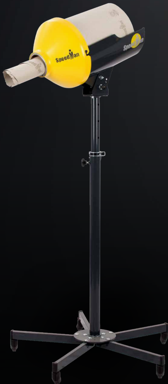
SpeedMan® Classic mit Rollgestell