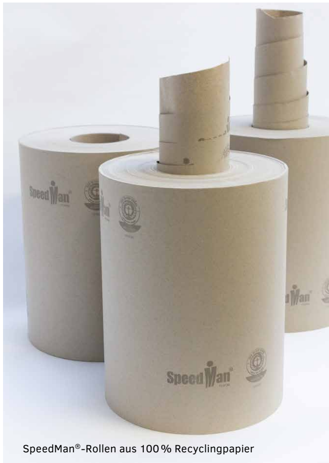
SpeedMan®-Rollen aus 100 % Recyclingpapier